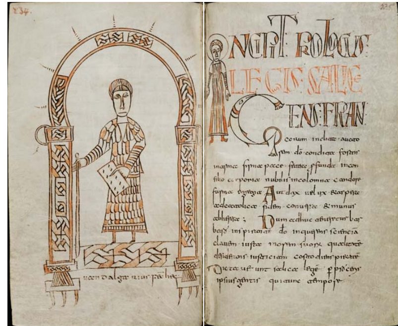
Wandalgarius fec. hec. / Incipit Prologus Legis Salice / Gens Francorum inclita... St. Gallen, Stiftsbibliothek, Cod. Sang. 731 fol. 234 v , 235 r ( www.e-codices.unifr.ch )